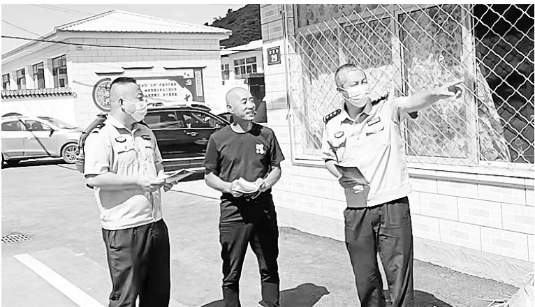
承德市公安局双滦分局偏桥子派出所民警在大贵口村宣传反诈知识。

“家门口有了警务站,老百姓方便了,但能不能在警务站里办一个物品临时放置点,让我们这些岁数大的人外出时能临时放一下物品。”承德市民刘大爷对上门走访的社区民警提出了自己的建议,不到一周,承德市区警务站都设置了物品临时放置点,群众拍手称赞。在“我为群众办实事”实践活动中,承德市公安局大力开展和谐警民关系提升行动,坚持“请进来问计问效、走出去共助共建、零距离服务群众”,倾听群众呼声,积极回应群众关切。迄今,全市公安机关召开“向人民报告”座谈会152次,征求意见建议576条;与246家企业、学校建立共建关系,开展共建活动35次;完成民警走访7654次,为群众解决实际困难1434件次,收到锦旗168面、感谢信299封,得到人民