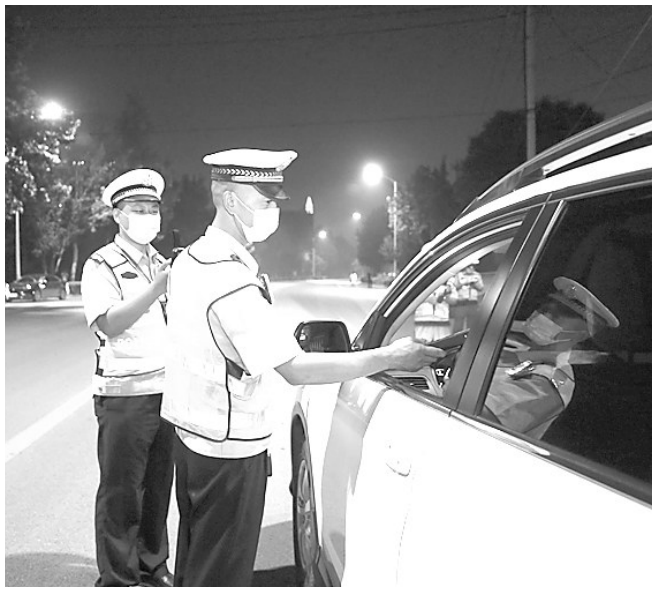
为维护辖区道路交通秩序，最大限度地预防和避免酒后驾驶引发道路交通事故，确保广大群众平安出行，邯郸交巡警支队涉县大队开展酒醉驾统一行动。图为9月8日晚，执勤民警对过往车辆驾驶员进行酒精检测。

办检察官经审查全案证据材料，认为被害人马某某符合国家司法救助条件。该院即刻启动国家司法救助程序，结合当事人申请，完善相关材料，及时将4万元司法救助金发放到马某某手中。 该院总结近年来为涉案未成年被害人提供思想疏导、宣传教育、法律援助等多种方式救助经验的基础上，探索以支付救助金为主要方式，“思想疏导+宣传教育+法律援助”等多元的综合救助体系。检察院在办理周某某某强奸养女案中，发现被害人属于事实无人抚养儿童，依法委托司法局指定律师提供法律援助；邀请专业社工和心理老师，对未成年被害人进行心理介入，帮助其摆脱心理阴霾，重树阳光向上的心态；提前介入阶段督导民政部门担任被害人的临时监护人，为其解决吃、穿、住基本生活问题。滦州市检察院已为未成年被害人和家长提供心理疏导14余次，取得了良好的政治效果、社会效果、法律效果。