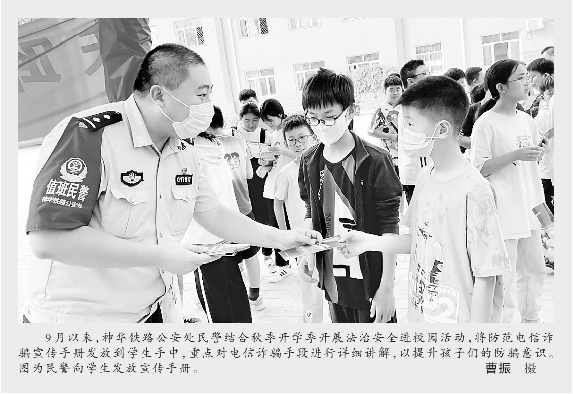
9月以来，神华铁路公安处民警结合秋季开学季开展法治安全进校园活动，将防范电信诈骗宣传手册发放到学生手中，重点对电信诈骗手段进行详细讲解，以提升孩子们的防骗意识。图为民警向学生发放宣传手册。

9月6日17时许，吴桥公安交警大队民警在杂技大世界路口执勤时，发现一辆大货车停在北立交桥上，桥洞底下散落一地化肥，车主正在焦急地清扫地上的化肥。执勤交警见状，立即跑上前去帮助司机清扫化肥，并维持周边交通秩序。原来，货车司机开车经过北立交桥时由于道路颠簸，导致近两吨化肥掉落。经过大约20分钟后，在交警和热心群众的帮助下，洒落在地上的化肥终于被清理完毕。