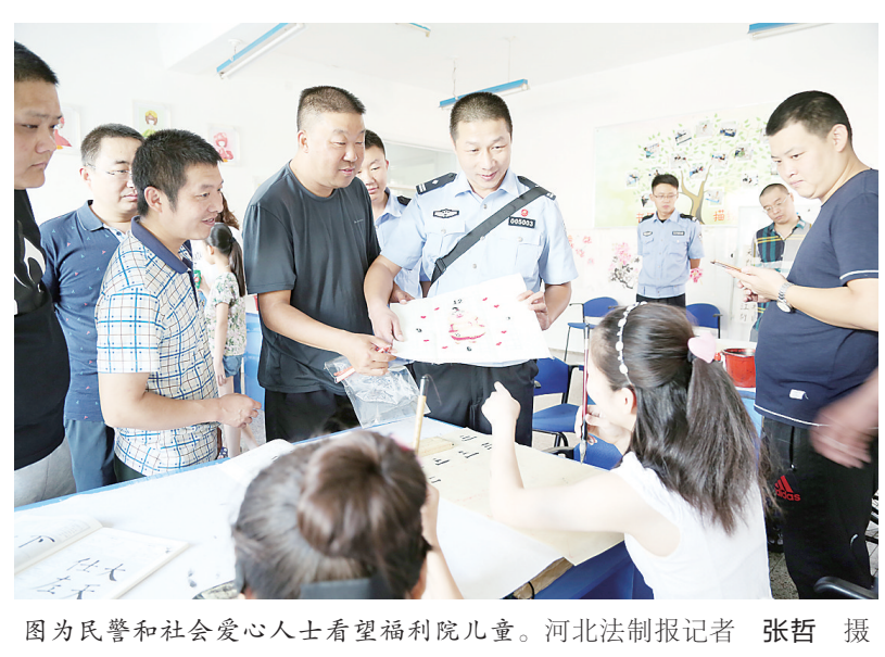
图为民警和社会爱心人士看望福利院儿童。

在规范执法的同时，突出“为民服务”。在执法服务大厅优化了休息座椅，增设了引导服务台、饮水机、叫号机、急救药箱等，并公开办事流程、所需资料和收费项目，力争让办事群众一趟办结、不跑第二趟。 爱民警、保后勤，暖字入心。针对正式民警少、老龄化严重的情况，该党支部从关心民警入手，先后为10余名民警家属解决了就业问题；提升“五小工程”服务水平，为民警创造良好的工作生活