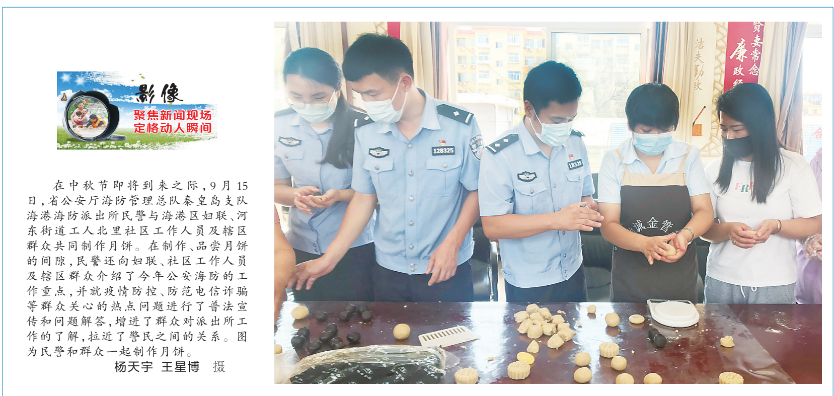
在中秋节即将到来之际，9月15日，省公安厅海防管理总队秦皇岛支队海港海防派出所民警与海港区妇联、河东街道工人北里社区工作人员及辖区群众共同制作月饼。在制作、品尝月饼的间隙，民警还向妇联、社区工作人员及辖区群众介绍了今年公安海防的工作重点，并就疫情防控、防范电信诈骗等群众关心的热点问题进行了普法宣传和答疑解惑，增进了群众对派出所工作的了解，拉近了警民之间的关系。图为民警和群众一起制作月饼。