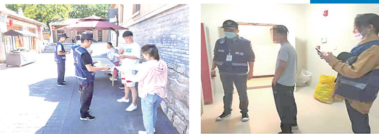
7月16日,“蓝马甲”治安志愿者在龙泉关镇开展禁毒宣传,发放宣传页1500余张。