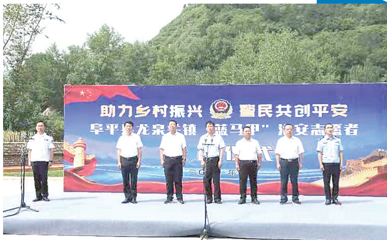
7月16日,阜平县龙泉关镇骆驼湾村“蓝马甲”上岗仪式现场。