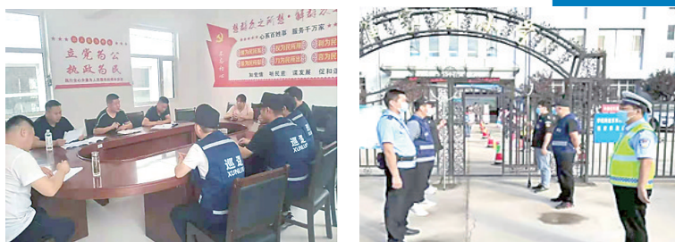
6月22日,“蓝马甲”治安志愿者与“帮大哥”一同在阜平镇城厢村村委会调解纠纷。