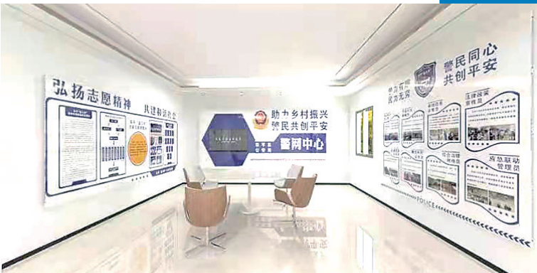
8月,阜平县公安局建立警网中心,引入科技手段,实现“蓝马甲”扁平化指挥。