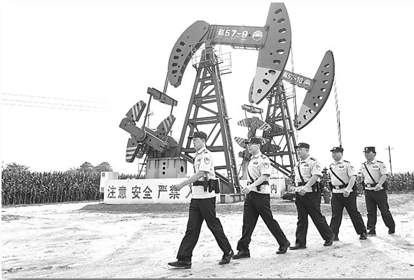
图为辛北分局赵邑派出所民警在油区一线巡逻。