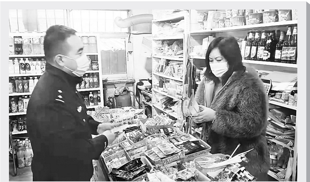
为进一步规范出租房屋和流动人口管理，秦皇岛市公安局北戴河分局东山派出所于11月22日到24日在辖区范围内组织开展了专题宣传活动。社区民警会同户籍工作人员进村居、进企业、进机关、进门店、进校园，向群众讲解居住证登记办理流程，普及相关法律法规，认真解答群众咨询，共发放宣传材料300余份，接受群众咨询200余人次。

据组织者表示，“文明交通平安出行”活动，有助于提高广大市民群众的积极踊跃参与，有助于共同营造安全、文明、有序、畅通的交通环境，更好地传递文明交通理念，打造现代化品质生活之城，为铸造“新保定”这座理想大厦添砖加瓦。