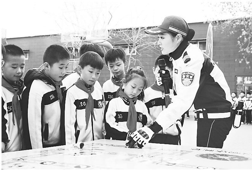
11月24日，邯郸交巡警支队渚河大队民警走进邯郸市新曙光第四小学开展交通安全主题教育活动。

党史学习教育开展以来，邯郸市公安局在原有户政服务延时办、错峰办、上门办、自助办等一系列便民服务的基础上，在市内四区所有派出所及各县级公安局城关派出所