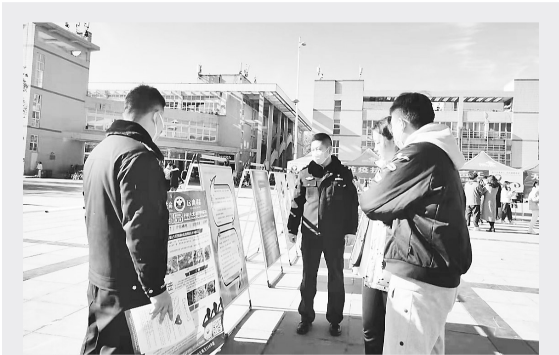
今年12月1日是第三十四个“世界艾滋病日”。为进一步营造禁毒防艾氛围,当日上午,石家庄市公安局裕华分局禁毒专班、石家庄市裕华区疾控中心等单位在河北科技大学开展了以“禁毒防艾,你我同行”为主题的禁毒宣传活动,积极为广大师生宣传禁毒知识、毒品的危害性及因吸毒而感染艾滋病的利害关系,倡议“拒绝毒品、远离艾滋、珍惜生命”。图为活动现场。

省法宣办将向各地各部门通报本次干部宪法法律知识考试成绩。各地各部门组织参加考试情况,将作为“八五”普法规划实施考核评价的重要参考。