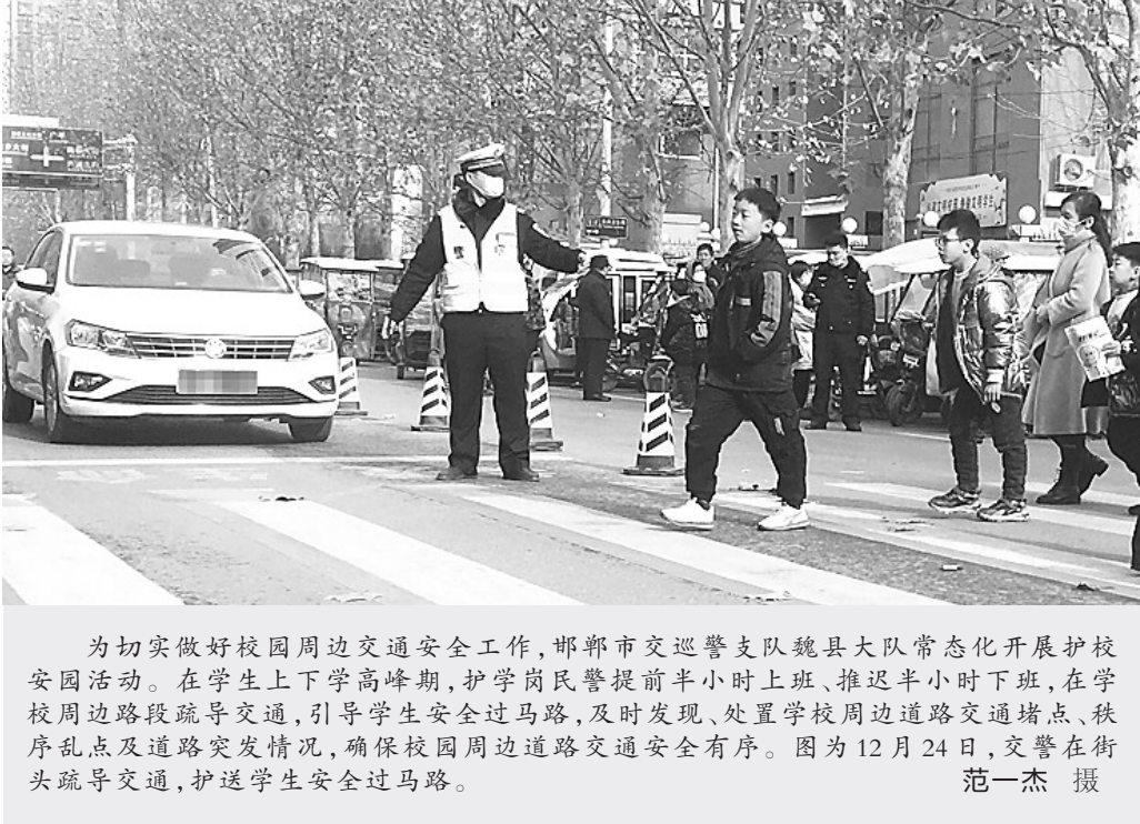
为切实做好校园周边交通安全工作，邯郸市交巡警支队魏县大队常态化开展护校安园活动。在学生上下学高峰期，护学岗民警提前半小时上班、推迟半小时下班，在学校周边路段疏导交通，引导学生安全过马路，及时发现、处置学校周边道路交通堵点、秩序乱点及道路突发情况，确保校园周边道路交通安全有序。图为12月24日，交警在街头疏导交通，护送学生安全过马路。