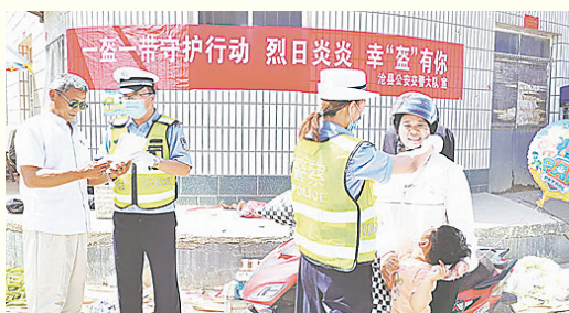
民警在辖区村庄为村民宣讲骑乘电动自行车佩戴头盔的重要性。