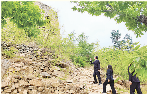
公益诉讼检察人员踏查罗文峪长城。

永远的精神家园,是祖先留给我们的一笔丰厚的文化遗产。保护长城、传承中华精神根脉,燕赵儿女义不容辞。全省检察机关充分发挥公益诉讼检察职能,主动担当、积极作为、全面融入、全力保障,积极探索开展长城保护领域公益诉讼检察工作,为长城保护贡献了检察智慧和检察力量。