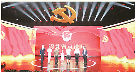
《党旗下的法治温暖》获省直工委“创先争优”典型案例征集获奖作品特等奖。

共法律服务体系系列宣传专题,立足于让人民群众了解、知晓公共法律服务,努力营造人民群众“办事依法、遇事找法、解决问题用法、化解矛盾靠法”的良好氛围,取得了良好的社会效果,切实提升了人民群众对公共法律服务工作的知晓率、首选率、满意率。