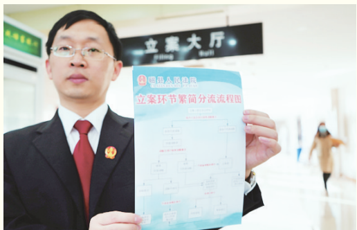
法官展示立案环节繁简分流流程图。