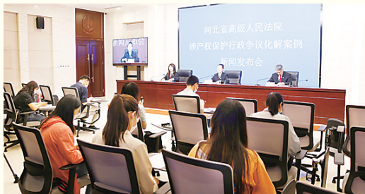
河北省高级人民法院召开涉产权保护行政争议化解案例新闻发布会。