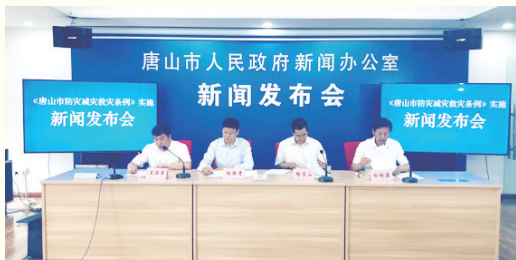
《唐山市防灾减灾救灾条例》实施新闻发布会现场。