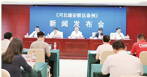
《河北雄安新区条例》实施新闻发布会现场。