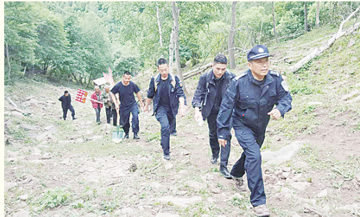
民警带领群众在山中踏查毒品原植物。

福祉,毒品一日不除,禁毒斗争就一日不能松懈。承德市禁毒委和市公安局牢记职责使命,有力推进禁毒人民战争,取得了骄人的战绩,使全市毒情得到进一步有效遏制,成功守护了城市安宁,有效维护了群众安全和幸福。