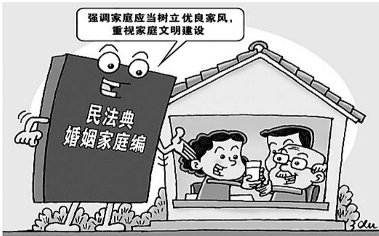
新华社发 徐骏 作

经过证据审核,庭审辩论,法院认为,从该“遗嘱”的内容看,明显倾向被告李泉海,虽然上面有李大明本人签名,但不能确认是否是李大明的真实意思表示;从形式上看,我国民法典并未规定“共同遗嘱”形式,该“遗嘱”与代书遗嘱较为接近,但这份“遗嘱”缺乏代书遗嘱应当由两个以上见证人在场见证,由其中一人代书,并由代书人和其他见证人签名等形式要件。因此,法院认定王喜凤、李泉海提供的“遗嘱”不符合民法典规定的