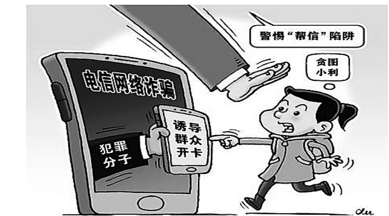
警惕陷阱 新华社发 徐骏 作