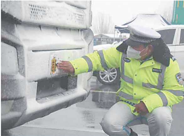
图为民警在路上检查过往车辆。

连日来,面对突如其来的疫情,廊坊市公安交警支队全体民、辅警并肩逆行,迎风战雪,用坚守和时间同疫情赛跑,用忠诚和担当筑起防疫屏障,全力守护辖区人民群众的