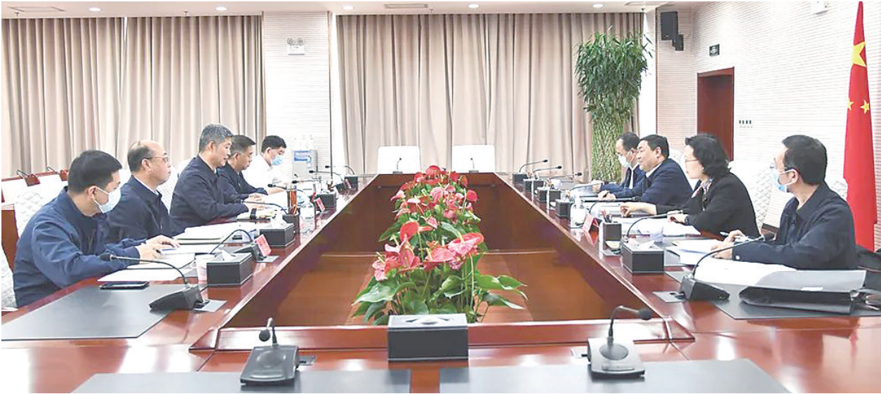
图为座谈会现场。

“深入贯彻落实‘八号检察建议’,推动安全生产抓早抓小抓苗头,切实做到防患于未然,需要把各项措施进一步细化和实化。”座谈中,丁顺生要求全省检察机关要主动加强与各级应急管理厅的协作配合,建立常态化联络联动机制,切实推动行政执法与刑事司法的