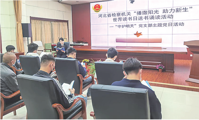
图为检察人员带头诵读图书的场景。