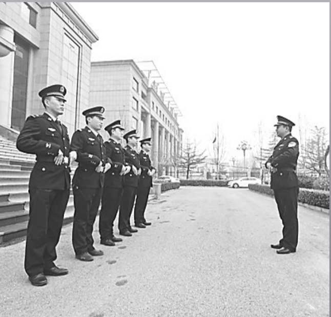
曲周县检察院司法警察大队细化警务培训制度,以强化司法警察融入检察工作的本领为目标,持续抓好《人民检察院司法警察训练大纲》的落实,灵活运用“检法警队联合训练”“每周一训”、邀请“外脑”授课等方式,广泛开展“六小练兵”活动,确保司法警察基本技能和体能训练常态化,有效提升岗位练兵质效,为检察工作创新发展提供有力警务保障。图为该院司法警察大队邀请县法院司法警察一起进行警务技能训练。