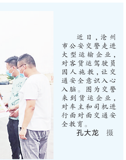
近日，沧州市公安交警走进大型运输企业，对客货运驾驶员因人施教，让交通安全意识入心入脑。图为交警来到货运企业，对车主和司机进行面对面交通安全教育。

魏县检察院采取“线下”加“线上”的方式开展联合执法检查 and 普法宣传活动4次，通过走访和视频连线的方式，对全县59个小区及10余家企业、商场的消防安全工作进行执法检查，向相关负责人普及消防安全常识，做到疫情防控和消防安全监管两不误。曲周县检察院坚持以案释法，通过解读案例向企业指出当前安全生产及监管工作中存在的普遍性、倾向性问题，并提出了“提前防范好显性和隐性双重安全风险”的意见建议，引导企业知其文、晓其意、明其理、践其行、守其则。