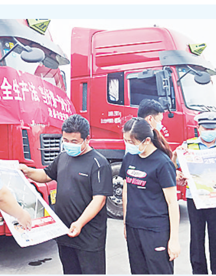
近日，沧州市公安交警走进大型运输企业，对客货运驾驶员因人施教，让交通安全意识入心入脑。图为交警来到货运企业，对车主和司机进行面对面交通安全教育。

从台区检察院走访两家企业，详细了解企业的从业资质审核、安全设备审核等事项，向企业提出了防范安全生产风险的建议。永年区检察院实地走访企业和施工现场，详细了解安全生产应急预案、安全防护设施等情况，要求企业完善相关规章制度，防范和遏制各类安全生产事故发生。峰峰矿区检察院走访辖区企业，实地查看企业安全生产经营情况，主动问需于企，听取他们对检察工作和优化法治化营商环境的意见建议，并对企业员