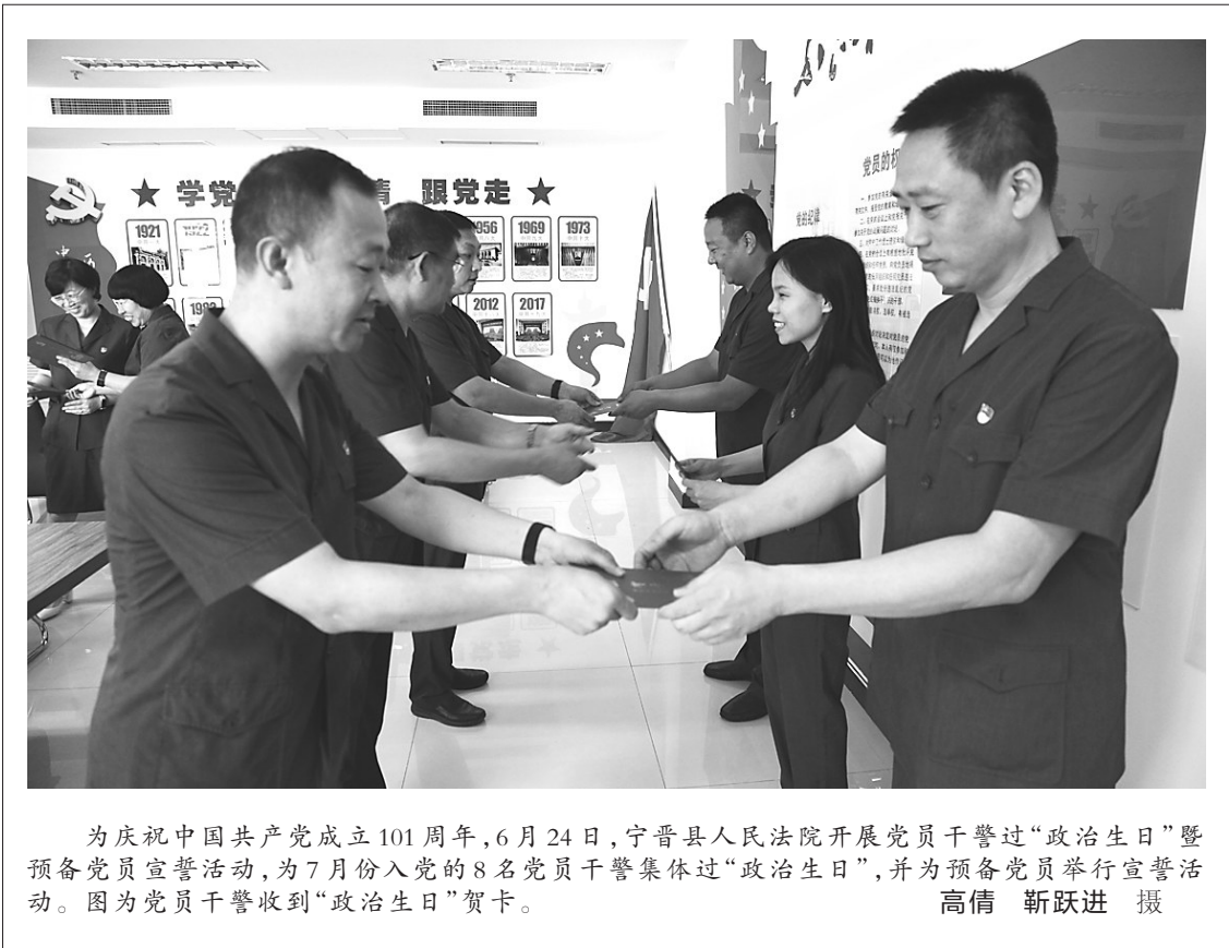
为庆祝中国共产党成立101周年,6月24日,宁晋县人民法院开展党员干警过“政治生日”暨预备党员宣誓活动,为7月份入党的8名党员干警集体过“政治生日”,并为预备党员举行宣誓活动。图为党员干警收到“政治生日”贺卡。