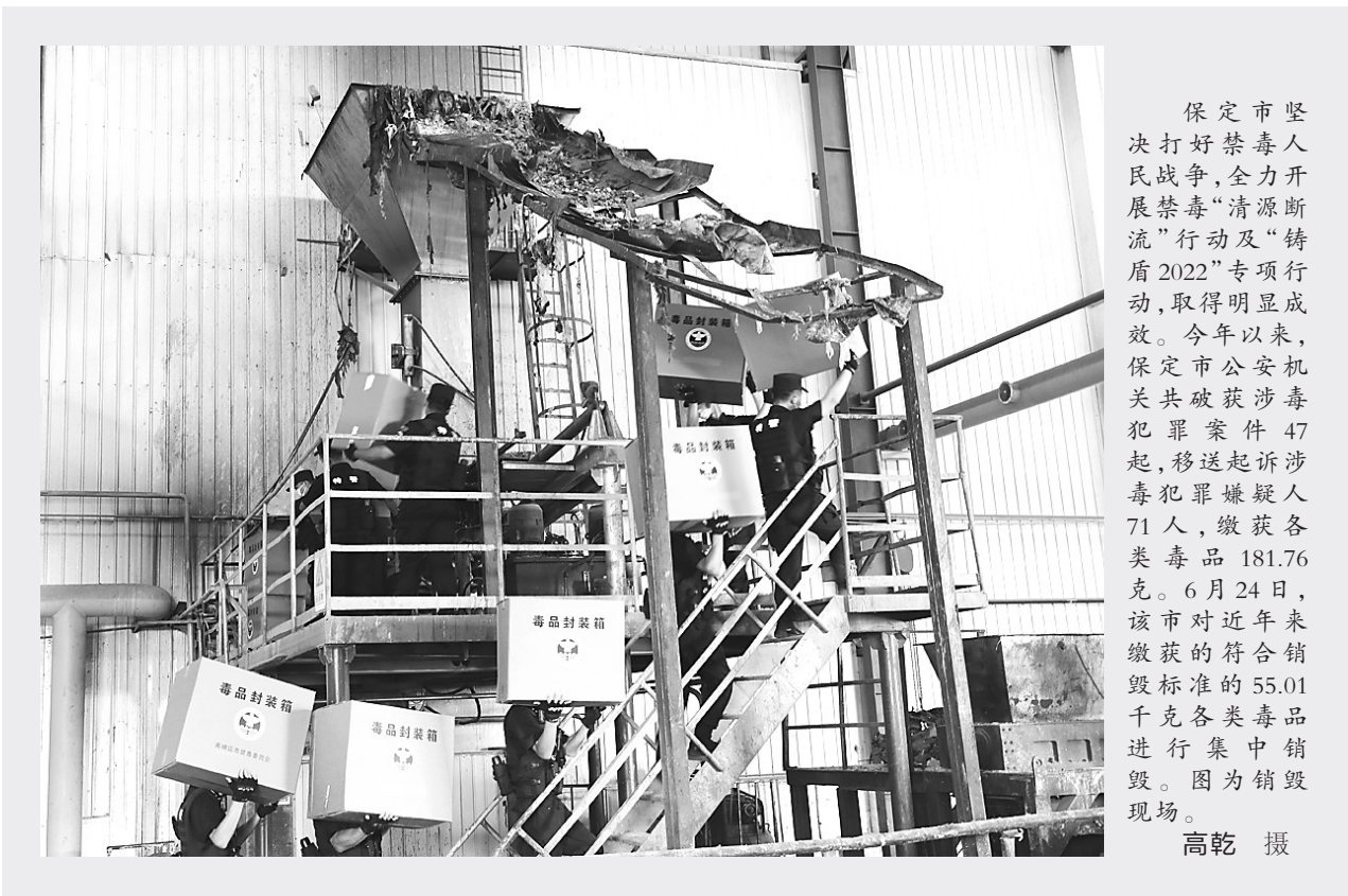
保定市坚决打好禁毒人民战争，全力开展禁毒“清源断流”行动及“铸盾2022”专项行动，取得明显成效。今年以来，保定市公安局机关共破获涉毒犯罪案件47起，移送起诉涉毒犯罪嫌疑人71人，缴获各类毒品181.76克。6月24日，该市对近年来缴获的符合销毁标准的55.01千克各类毒品进行集中销毁。图为销毁现场。

民警辅警们表示，无论再美的书画，也诉不够对党的衷肠；无论再美的颂歌，也唱不尽党在我们心中的分量！大家在支队党委的坚强领导下，高举旗帜、听党指挥，奋勇争先、砥砺前行，以实际行动迎接党的二十大胜利召开。