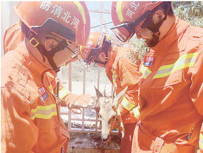
图为消防人员安抚狍子,进行解救。

为防止发生意外,对狍子造成伤害,穿戴好防护装备的消防救援人员先小心翼翼地接近,在距离较近的位置抚摸狍子的头部让其放松。似乎是感觉到消防救援人员的善意,狍子开始逐渐配合消防救援人员的