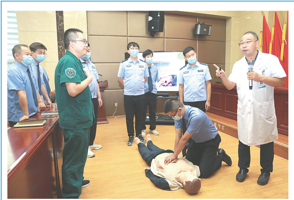
为不断健全完善便民利民服务举措,提升服务群众质量,及时妥善处理来访群众突发心脏疾病状况,提供紧急救助服务保障,近日,保定高新区人民检察院在12309检察服务中心配备了一台AED。AED是一种便携式医疗设备,它可以诊断特定的心律失常,并且给予电击除颤,是可被非专业人员使用的用于抢救心脏骤停患者的医疗设备。该院在门口及附近醒目位置张贴了AED标识,提示周边单位和群众在遇到紧急情况时可随时取用该设备。该院还邀请市急救中心医护专家,开展了一次专业急救技能和AED使用维护培训,让检察干警学会了关键时刻拯救生命的技能。图为检察干警在学习AED使用方法。

近日,经执行干警组织调解,双方当事人达成和解协议,被执行人除了将上次拍卖留给孩子的26万元付给申请执行人抵顶外,剩余欠款约定每月偿还5万元,直至全部付清。