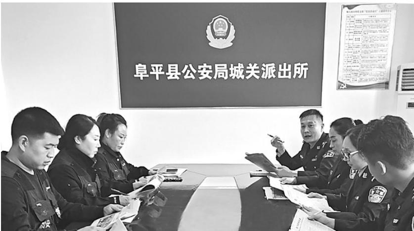
图为民警辅警和义警一起学习领会党的二十大精神。

“我舅舅接到过一个冒充他家孩子要学费的电话。”在一家小超市门前，一位顾客说。“遇到