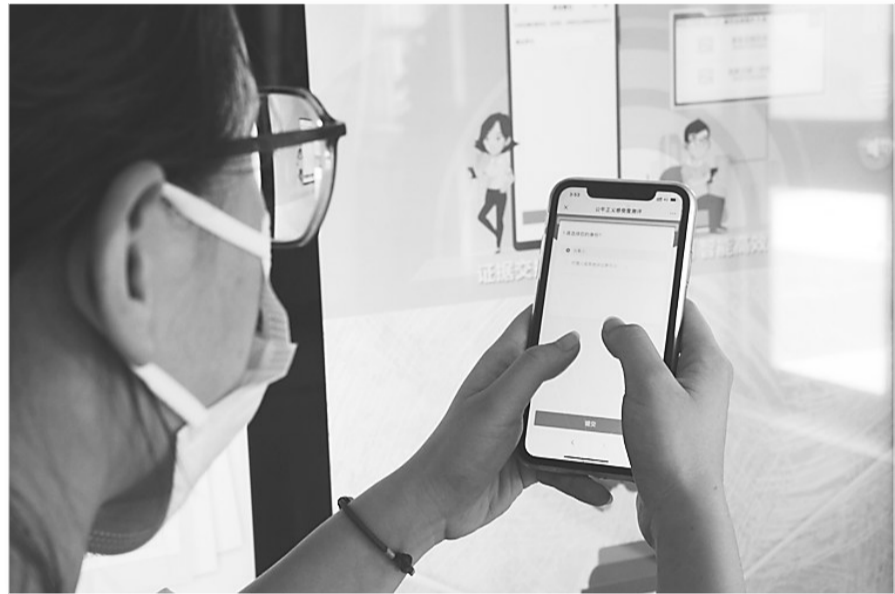
市民通过“码上通”系统反馈意见。