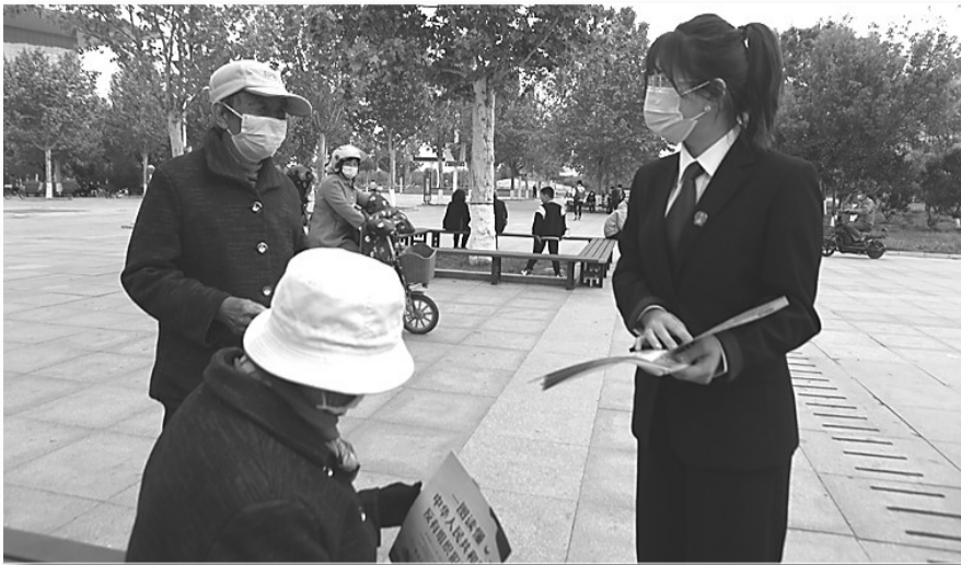
走上街头宣传法律知识。

来抓,深化府院联动,通过“清算与破产审判庭”授牌、完善预重整制度、引进破产信息平台、设立破产管理人基金等措施,形成办理破产案件工作合力。