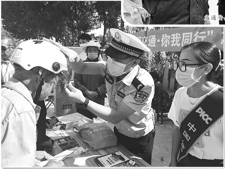
为群众讲解安全头盔佩戴方法。