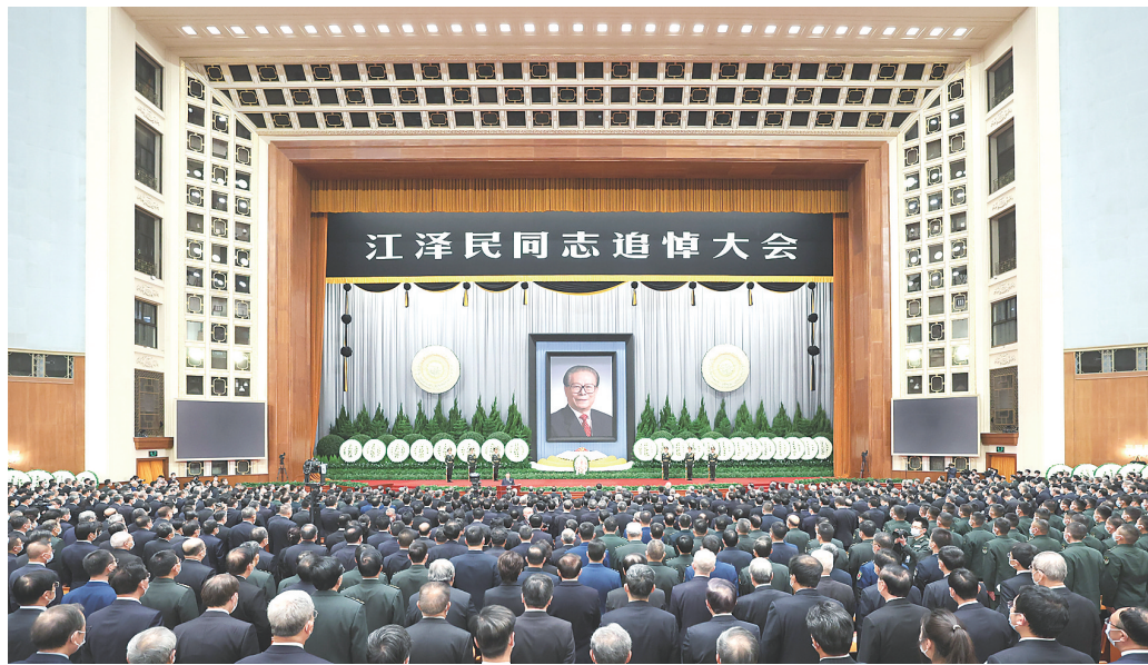
12月6日，中共中央、全国人大常委会、国务院、全国政协、中央军委在北京人民大会堂隆重举行江泽民同志追悼大会。