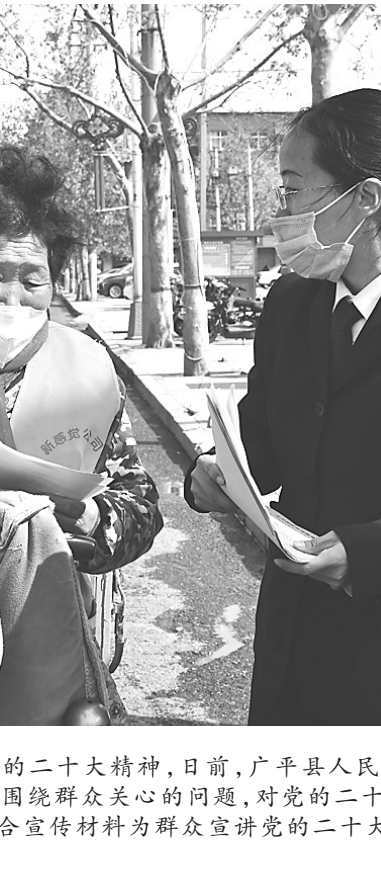
为全面深入学习宣传贯彻党的二十大精神，日前，广平县人民法院干警走进辖区街道社区，通过发放宣传页、现场解答等方式，围绕群众关心的问题，对党的二十大精神进行解读和宣讲，把法治精神传递给基层群众。图为干警结合宣传材料为群众宣讲党的二十大精神。