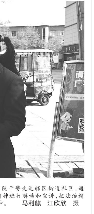
为全面深入学习宣传贯彻党的二十大精神，日前，广平县人民法院干警走进辖区街道社区，通过发放宣传页、现场解答等方式，围绕群众关心的问题，对党的二十大精神进行解读和宣讲，把法治精神传递给基层群众。图为干警结合宣传材料为群众宣讲党的二十大精神。