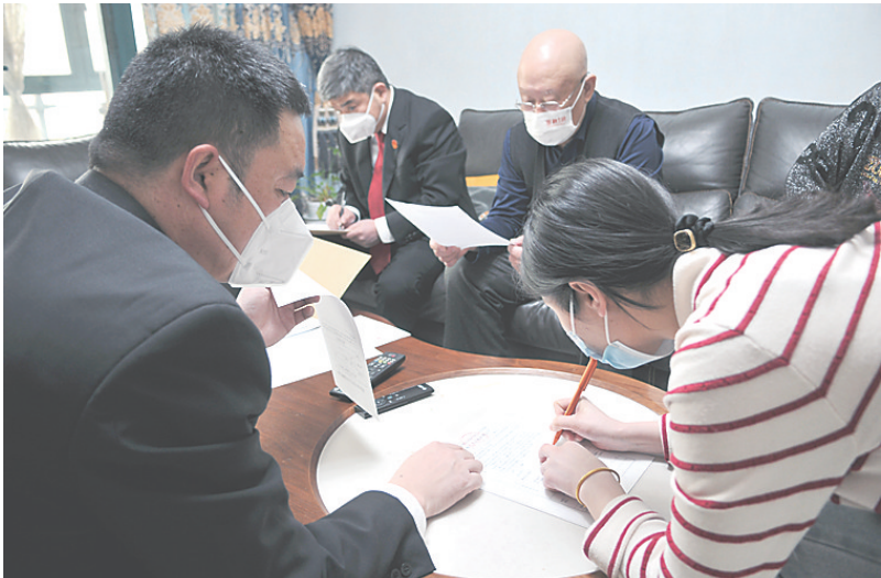
图为双方当事人在执行法官的主持下签署和解协议。