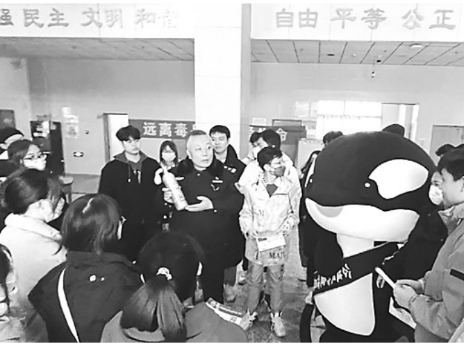
近日，秦皇岛市公安局海港分局组织开展“反诈·禁毒·法治宣传进高校”系列活动。2月18日下午，在河北科技师范学院学术交流中心，分局反诈中心、禁毒大队和燕园派出所的民警辅警们会同公益反诈宣传员深入师生中间，向大家宣讲反诈、禁毒和法治知识。图为民警为大学生们科普新型毒品的形式与危害。

黄牛随时有可能受到惊吓乱跑。民警立即采取措施，会同高速公路清障部门在最短时间合力将这头黄牛拉上清障车，消除了险情。经了解，原来是拉运牛的货车栅栏有破损，导致这头黄牛掉落在高速公路。民警对随后赶来的货车驾驶员进行了批评教育。