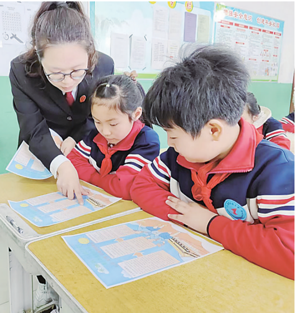
图为法官向学生讲解法律知识。

授课结束后,干警们向学生发放了预防校园暴力等与校园安全相关的宣传单,认真倾听学生的学习体会和感想,就学生们不易理解的内容逐一进行详细解读。