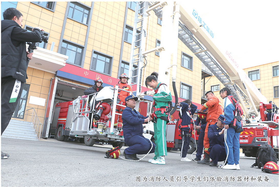
图为消防人员引导学生体验消防器材和装备。

河北法制报讯 (记者梁燕)3月23日,张家口市消防救援支队尚义县救援大队开展消防站开放日活动,迎来尚义县第二中学师生们参观学习。师生们“零距离”体验消防站生活、感知消防文化、学习消防知识、感受消防魅力。