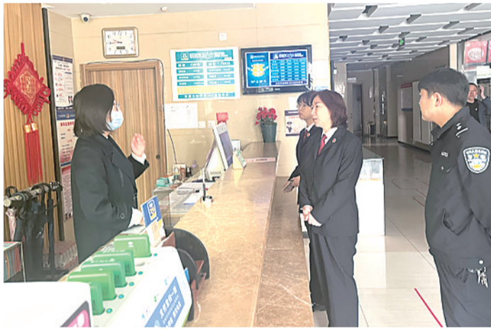
图为检察人员正在向旅馆经营者了解相关情况。

专项监督活动中，该院“小源来啦”未检工作室成员重点查看经营单位的住宿登记电子记录册、公共视频监控，现场向工作人员核实是否严格落实“一人一证”实名入住登记制度；排查是否在显著位置悬挂上墙“五必须”“侵害未成年人案件强制报告”及禁赌、禁毒等内容的宣传海报和标志；是否违