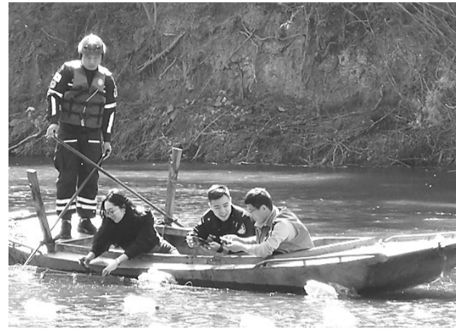
图为文化节上,民警与村民、社会公益组织成员一起划船取蚌。