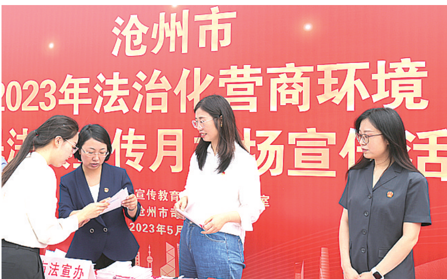
图为宣传活动现场。

河北法制讯（王鲜 安玉）法治是最好的营商环境。日前，沧州市在全市开展法治化营商环境政策法规宣传月，助力打造具有沧州特色的新时代法治化营商环境，为加快建设现代化沿海经济强市贡献法治力量。 强化主体责任意识普法。沧州市法治宣传教育领导小组办公室印发了《关于开展2023年法治化营商环境暨民法典宣传月活动的通知》，指导、督导全市各地各部门刚性落实“谁执法谁普法”责任制，扎实做好“营商环境宣传月”主题宣传。5月19日，沧州市法宣办组织市发改委、市法院、市检察院、市公安局、市商务局等27家市直机关单位，在广场参加普法活动。工作人员向过往群众发放法治宣传材料，深入开展民法典、特别是营商环境相关法律法规宣讲，并结合职能解答群众问题，提升了群众对营商优惠政策及相关惠民政策的知晓率。各县（市、区）也开展了相关活动。