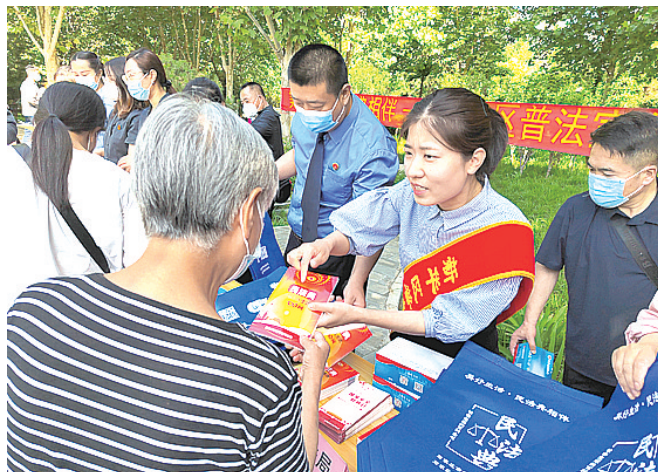
图为普法志愿者向群众介绍民法典知识。

服务，耐心细致地答疑解惑。普法志愿者向居民群众发放了宪法、民法典等法律法规读本、口袋书、宣传折页等2000余册，法治宣传品1000余份，现场解答群众法律咨询50余人次。 据了解，针对新形势下人民群众对多元化、差异化、宽领域的法治化需求，新华区司法局建强法治文化宣传阵地，突出“三结合、三贴近”，即结合法治宣传重点，贴近居民群众需求；结合社会舆论热点，贴近解决现实问题；结合老旧小区改造，贴近居民群众身边。近年来，新华区不仅重点打造了法治文化主题公园，还设立了朝阳社区法治宣传墙等一批法治文化宣传阵地，让民法典贴近群众身边、走进群众心里。