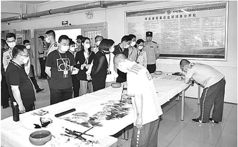
图为受邀代表观看监狱服刑人员书法展示。

针对与会代表提出的意见建议,河间市检察院相关负责人表示,该院将在今后的公益诉讼监督中,不断完善监督措施,在市人大常委会的监督下,高效履行好检察法律监督职责,不断提升监督质量,为人民群众进一步营造美丽的人居环境,提升幸福生活指数贡献检察力量。