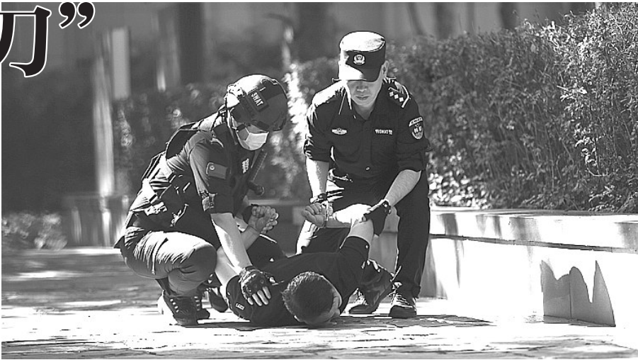
图为特警队员在模拟处置警情。

随时待命的特警PTU武装车组,着装规范、警容严整、士气昂扬,坚持“实兵、实情、实装”,反应迅速、分工明确,规范、及时处置了模拟警情,在提高队员警务实战技能的同时,进一步增强队员间的相互配合意识、协同作战意识,提升队伍应对处置突发事件的能力。