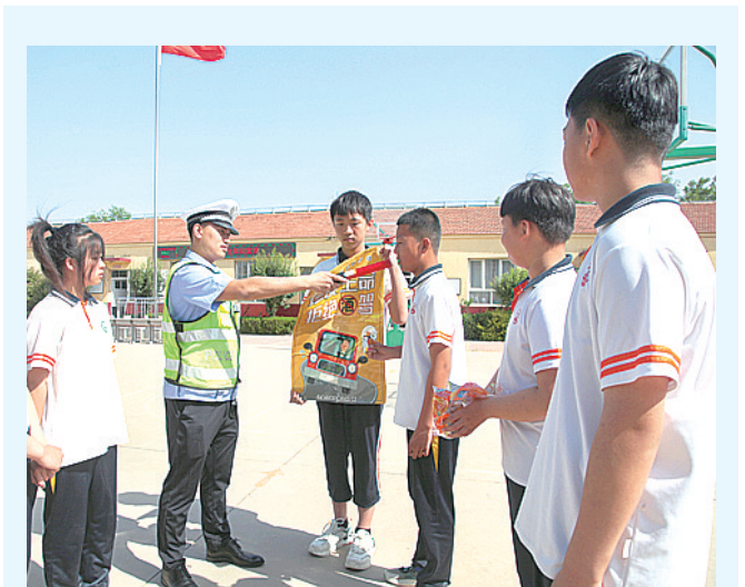
日前，沧县公安交警大队走进辖区小学开展交通安全教育活动。活动中，民警为同学们讲解交通安全知识，并对各种警用装备等作详细讲解，进一步提高了他们的交通安全意识。图为民警带领同学体验酒精测试仪。

优化景区周边通行秩序。通过景区周边高地联动、路警联动，最大限度提高通行效率，避免群众出不了站口、到不了景区。