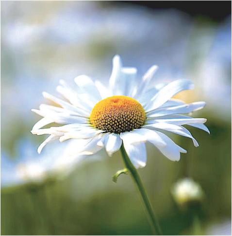
绽放 姜晓霏 摄 (作者单位:廊坊市广阳区人民检察院)