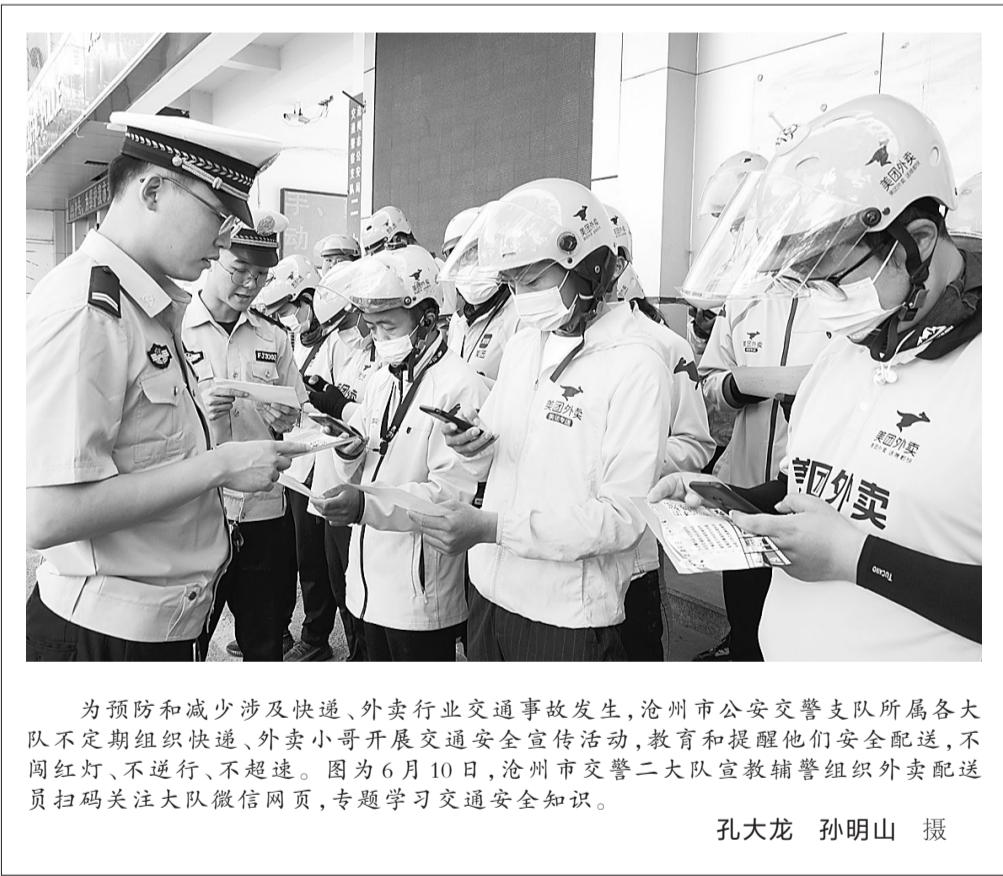
为预防和减少涉及快递、外卖行业交通事故发生,沧州市公安交警支队所属各大队不定期组织快递、外卖小哥开展交通安全宣传活动,教育和提醒他们安全配送,不闯红灯、不逆行、不超速。图为6月10日,沧州市交警二大队宣教辅警组织外卖配送员扫码关注大队微信网页,专题学习交通安全知识。

“道路千万条,安全第一条。如果心存侥幸、贪图便宜、无视道路交通法律法规,一旦造成无法挽回的交通事故,那么挣再多的钱都是徒劳,再美好的生活都荡然无存。”公开信言辞恳切,读罢令人动容。