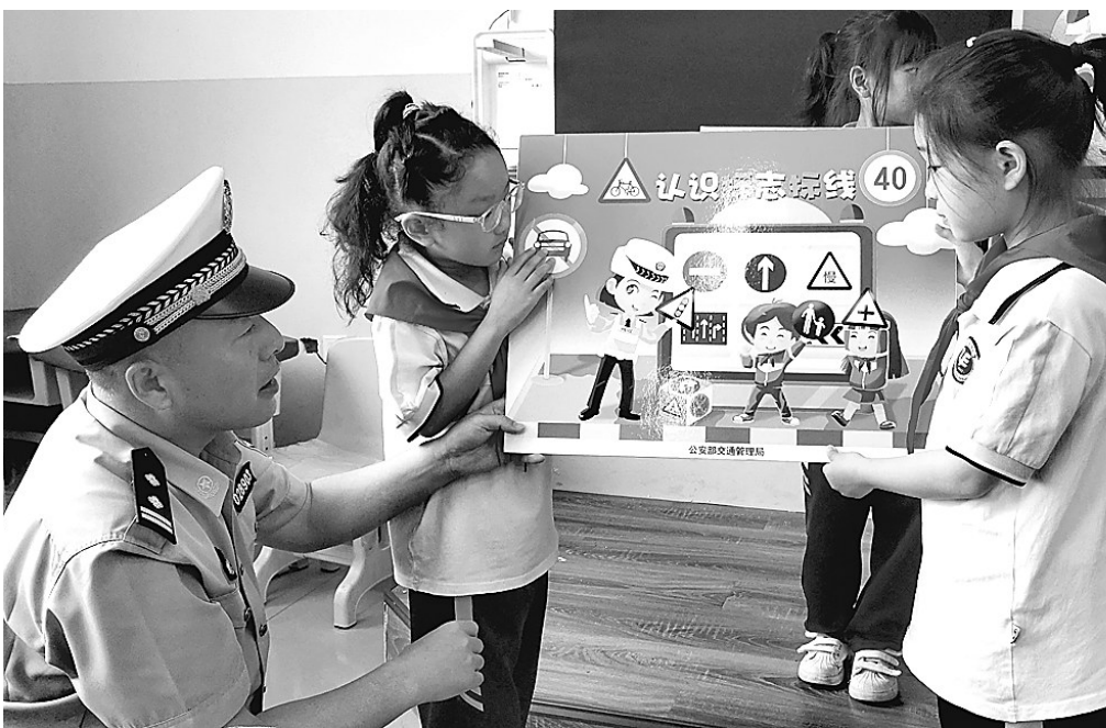
日前,邢台市公安交警支队襄都区一大队民警走进辖区雷锋小学开展主题交通安全宣教活动。活动中,民警结合交通安全宣传课件、宣传画册等,宣讲了与同学们日常出行密切相关的交通安全基本知识和典型交通事故案例,并通过组织交通安全互动问答游戏等形式,在寓教于乐中让孩子们了解交通安全的重要性。图为民警为同学们讲解交通安全知识。

同时,该分局抽调有心理咨询师资质的民警与专业的心理咨询师组成心理疏导小组,对受伤民警辅警给予心理辅导。2021年以来,该局组织开展20余次心理疏导讲座,帮助300余名民警辅警及时调适心理状态,有效缓解心理压力。