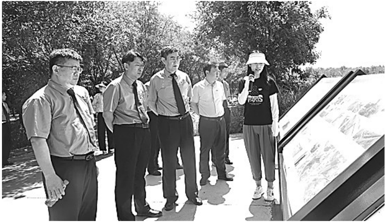
图为检察干警在七里海湿地开展公益诉讼实地研学。刘頔 王雅欣 摄

“截至目前,已有来自社会各行业的25人申请加入志愿者队伍,提供公益诉讼问题线索5条,为检察机关提供志愿者‘外脑’智慧,增强办案新动能,实现公益保护最优化、社会治理效果最大化发挥了重要作用。”灵寿县检察院检察长彭涛介绍。