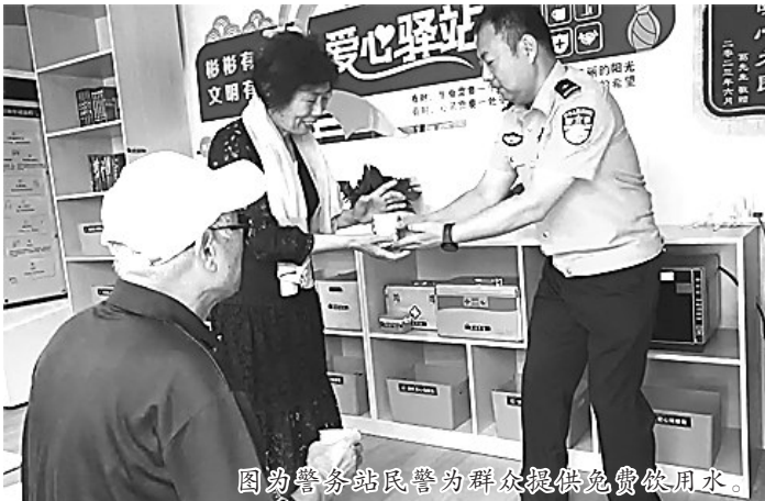
图为警务站民警为群众提供免费饮用水。

河北法制报讯（记者 张志青 通讯员 马晓川）近日，唐山市42家基层警务站建设的“便民爱心驿站”已全部面向社会免费开放，受到群众喜爱。唐山市公安局将警务站建成了公安机关服务群众的实践平台和密切联系群众的桥梁纽带。