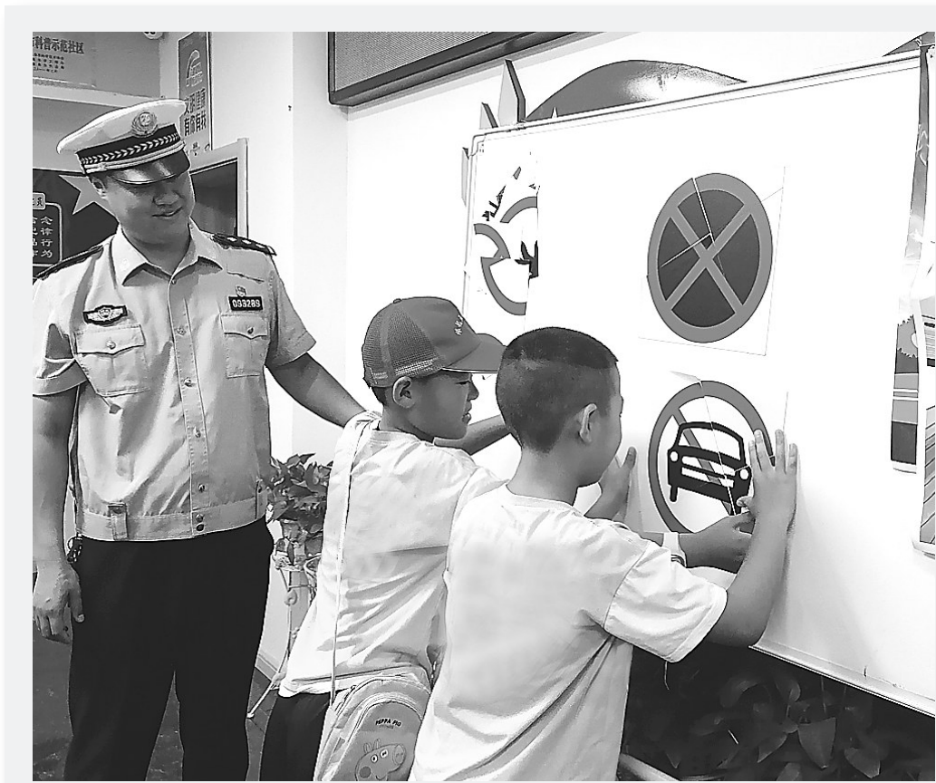
为提升群众交通安全意识，宣扬文明出行的理念，预防和减少道路交通事故，秦皇岛交警积极开展“五进”宣传活动，筑牢交通安全防线。图为7月12日，该市交警二大队宣传民警来到海港区天洋新城社区，给暑假中的孩子们上了一堂生动的交通安全课。

近日，石家庄市公安局经开分局结合夏季治安打击整治行动，组织各派出所民辅警在持续开展夜间巡逻的同时，向群众宣传预防电信诈骗相关知识，做到夜巡、反诈“两不误”。该局不断深化“百万警进千万家”活动，对在户外纳凉的群众、旅店入住人员以及烧烤摊就餐人员适时进行反诈宣传，进一步增强群众安全防范意识。图为民警向群众发放反诈宣传材料，讲解防范电信诈骗相关知识。