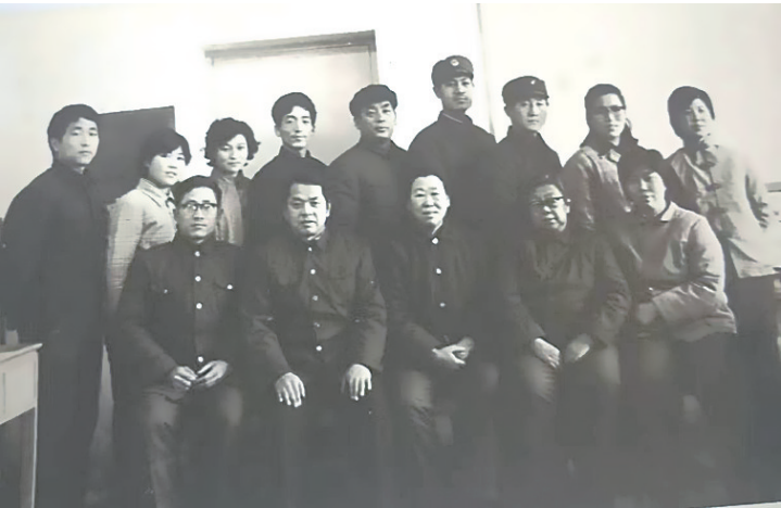
1983年《河北法制报》初创时期部分人员合影，图中前排左二为作者。

《河北法制报》正是在这样的时代背景下应运而生的。面对当时大部分群众和一些党员干部法律意识和法律知识还相当贫乏的状况，这张法制报刊，作为党和国家舆论宣传载体、宣传阵地，为社会稳定、长治久安，为国家经济发展保驾护航，为推动全民知法、懂法、遵法、守法做好宣传教育、普及法律知识，重任在肩，责无旁贷。