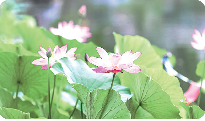
满塘素红碧 (作者单位:张家口市下花园区人民检察院)

父亲每天早上晚上跟着我读课文,一个字一个字纠正读音,一句一句揣摩语气。那段时间,父亲一心扑在工作上,语文教学取得了丰硕的成果,语文统考成绩连年是学区第一名,班里的学生参加竞赛也是多次获一等奖。父亲也因为教学成绩突出被多次评为优秀教师、市级骨干教师。 父亲习惯把学生称为孩子们,他对孩子们的爱,孩子们记在心里。父亲跟我讲起过他和孩子们之间的一件小事:他常常是学校里第一个到、最后一个走的人,晚上关学校的大铁门时,又大又沉的铁门十分难关。孩子们发现后,每天放学时悄悄帮他关上铁门,对齐两扇门的锁眼,只等父亲来锁。事不大但足见一片真情。 九十年代初,私立学校如雨后春笋。这时,有一位私立学校的校长跑到家里请父亲任教,那位校长反反复复来了三次,并承诺给予三倍的工资。父亲犹豫了,那位校长看父亲动了心,就将父亲的被褥及所用书籍先带到学校。当天夜里,乡亲们坐满了我家的小院。第二天,父亲抱歉地告诉私立校长,还在自己村任教吧。私立校长十分惊讶:“刘备三顾茅庐,诸葛亮都出师了,咋就说不动你呢?”父亲如实说:“确实为工资问题苦恼过,但一看到村里娃娃,其他的坏心情就都没了,