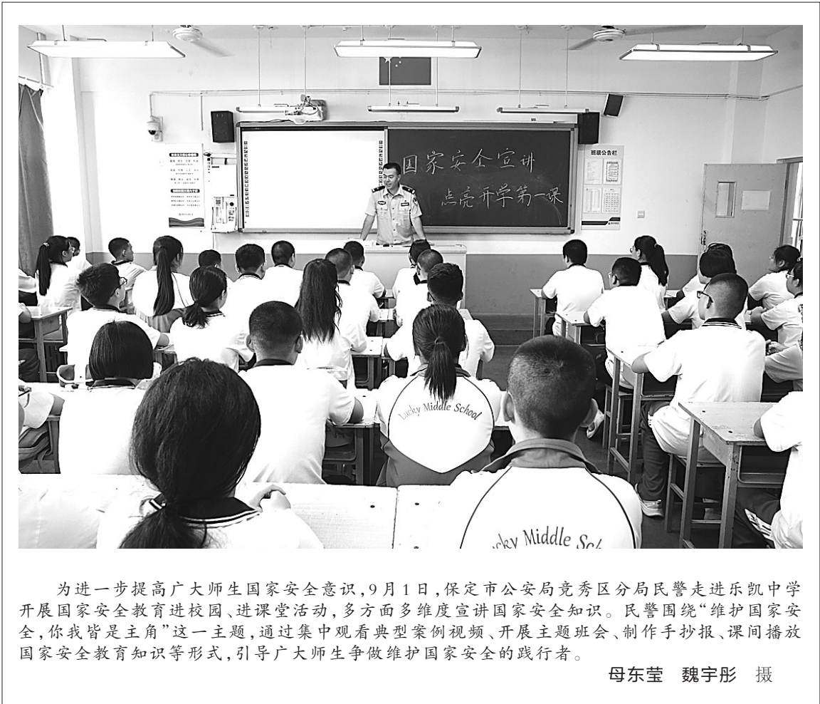
为进一步提高广大师生国家安全意识，9月1日，保定市公安局竞秀区分局民警走进乐凯中学开展国家安全教育进校园、进课堂活动，多方面多维度宣讲国家安全知识。民警围绕“维护国家安全，你我皆是主角”这一主题，通过集中观看典型案例视频、开展主题班会、制作手抄报、课间播放国家安全教育知识等形式，引导广大师生争做维护国家安全的践行者。

伍管理处处长李杰表示：“交通安全宣传题材打破了面塑的传统边界，非物质文化遗产面塑给交通安全宣传带来了创新和活力。” 据了解，承德市公安局交警支队将举办系列活动，带着交通安全面塑走进校园，让更多小朋友在欢乐中、在指尖上体验交通安全和传统文化。