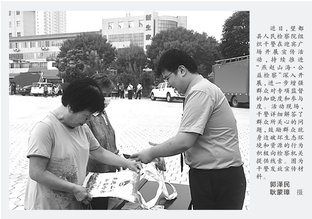
近日,望都县人民检察院组织干警在迎宾广场开展宣传活动,持续推进“燕赵山海·公益检察”深入开展,进一步增强群众对专项监督的知晓度和参与度。活动现场,干警详细解答了群众所关心的问题,鼓励群众就身边破坏生态环境和资源的行为积极向检察机关提供线索。图为干警发放宣传材料。