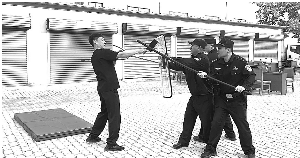
为全面提升民辅警警务实战技能水平和突发案事件现场处置能力,10月16日至19日,唐山市公安局东油分局在全局范围内组织开展了“红蓝对抗”警务实战训练。训练模拟个人极端暴力案事件等警情处置,提升了民辅警快速反应、协同作战能力。

出行。面对民辅警们的嘘寒问暖,老人脸上洋溢出温暖的笑容。临走时,老人紧握住民警的手再三表达谢意和感激之情。