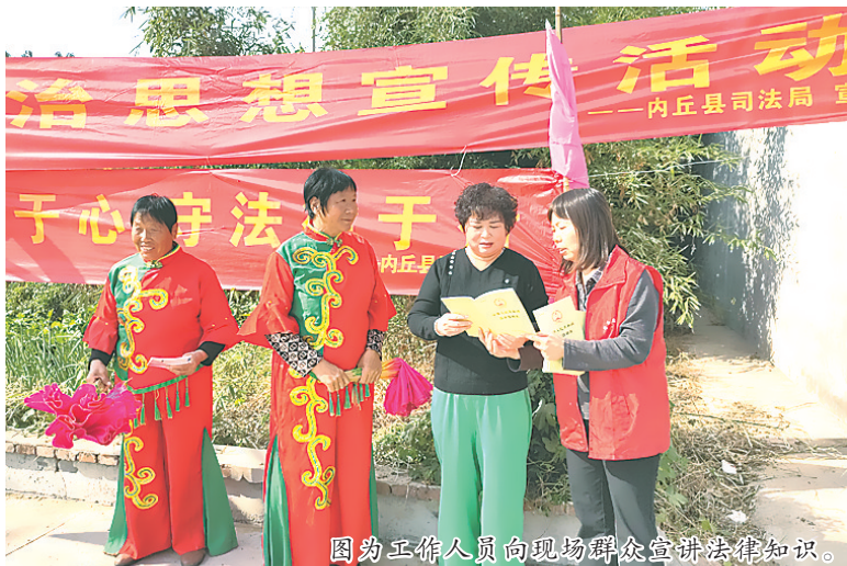
图为工作人员向现场群众宣讲法律知识。

活动中，工作人员重点开展了法律咨询、法治宣传、人民调解、法律援助等相关法律服务工作，广泛宣传了宪法、民法典、人民调解法、老年人权益保障法、法律援助法等与群众生产生活密切相关的法律法规。咨询台前，不少群众前来咨询问题，法律援助律师认真为前来咨询的群众答疑解惑，提供热情周到的法律服务。此次活动共发放各类宣传资料、法治小礼品500余份，提供各类法律咨询10余人。工作人员自编自演的法治文化节目也深受村民