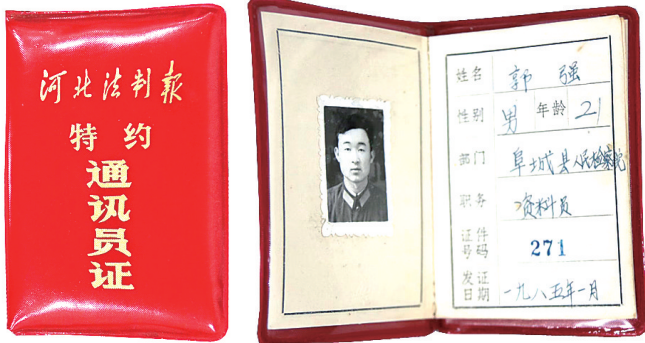
图为作者保存的特约通讯员证。

长期以来，不论工作多忙，我都坚持阅读《河北法制报》，遇到对自己有用的文章，我会随手剪贴下来，迄今已累计了60个剪贴本。这些剪贴本成了我的“粮库”，在我日常工作和学习中发挥了启迪、导向和助力作用，是我汲取丰富养料的源泉。比如我在召开局长办公会研究案件时，针对提请研究的案件，会在“案例剪贴本”上找出同一罪名、同一性质的案例提前“预习”，借鉴专家观点、办案人员认识等作为参考，然后结合具体案情，在充分听取大家的意见后，再对案件做出处理。虽然是“现学现卖”，但自己在把关定性上更有底气、更全面，对提高执法办案质量大有裨益。2007年8月，《河北法制报》记者韩志强以《一把剪刀一支笔，学习使我终身受益》为题，就我坚持读报剪报的事进行了报