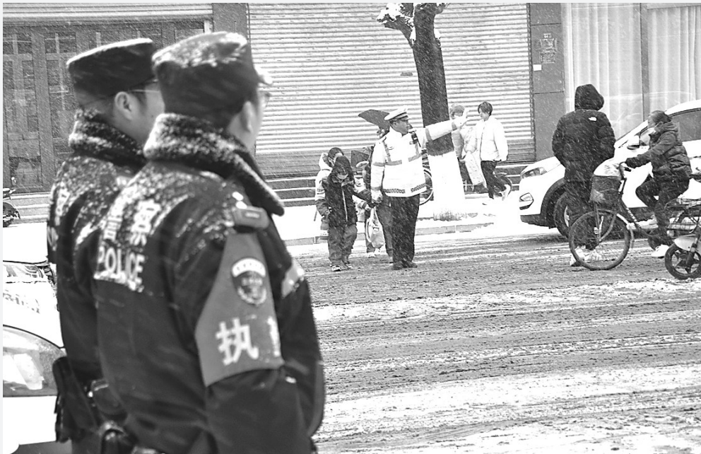
图为12月11日，三河市公安局交巡警在第二幼儿园门口护送学生安全过马路。

12月10日晚至11日，我省多地迎来降雪，路面变得湿滑。为确保群众出行平安，我省各地交警部门闻“雪”而动，迅速启动应急预案，加大路面管控和指挥疏导力度，加大雪天重点路口路段区域巡查力度，及时帮助遇困车辆，寒风里忙碌着一抹抹“荧光黄”。