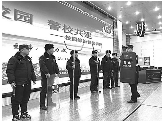
12月1日，邢台市公安局巡警支队教官团一行16人走进邢台学院，开展以“平安校园 警校共建”为主题的校园普法讲座。民警从校园贷、防电信诈骗、群众斗殴、毒品识别等多个方面，讲解了有效规避社会风险并依法保护自身安全的方式方法，并对学校保安人员进行安保技能战术培训。图为培训现场。

通过“一窗通办”，派出所窗口工作效率大幅提升，简易业务3至5分钟办结，为群众打造“最短服务半径”、提供最优服务，群众和企业的获得感和满意度持续提升。