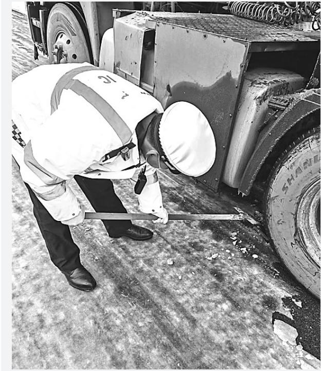
图为12月11日，一辆货车爬坡遇困，保定市公安局白沟新城分局交警及时清理车下路面冻住的积雪。

12月10日晚至11日，我省多地迎来降雪，路面变得湿滑。为确保群众出行平安，我省各地交警部门闻“雪”而动，迅速启动应急预案，加大路面管控和指挥疏导力度，加大雪天重点路口路段区域巡查力度，及时帮助遇困车辆，寒风里忙碌着一抹抹“荧光黄”。