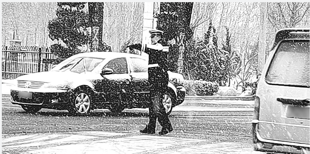
图为12月11日，沧州交警在104国道青县辖区疏导交通秩序。

河北法制报讯（凡捷 张励）今年以来，隆化县公安局深入开展大走访、大帮扶、优化营商环境等活动，构建起“改革有力度、办理有速度、服务有温度”的政务服务模式。目前，全县26个派出所及城区2个警务站均落实了“一窗通办”综合业务办理模式，“户籍+”业务覆盖全部公安窗口，累计办理业务一万余件。近日，承德市公安局在隆化县召开全市公安政务服务“一窗通办”和派出所“户籍+”延伸服务工作现场推进会。