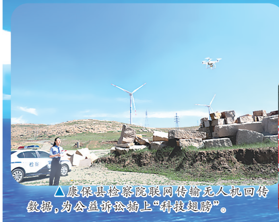
▲康保县检察院联网传输无人机回传数据,为公益诉讼插上“科技翅膀”。