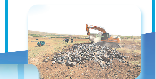
▲张北县检察院督促清理12000余吨杂石,守住百姓“口粮田”。

张家口市检察机关将始终围绕“四个领域”“八个一批”工作要求,从个案向类案,从前端向末端延伸,靶向施策,对症下药,做实“办理一案、教育一片、治理一域”,以坚定的决心、坚强的举措,立足检察职能守护好“燕赵山海”这道美丽的风景线。