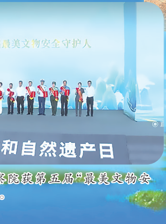
2023年文化和自然遗产日