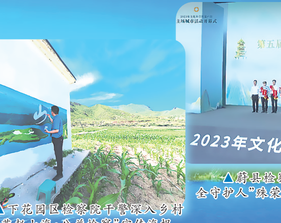
▲蔚县检察院获第五届“最美文物安全守护人”殊荣。