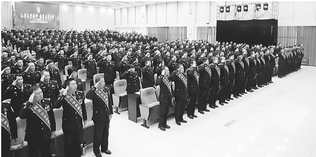
现场聆听的民警辅警集体起立、庄严敬礼，向公安英烈致敬！