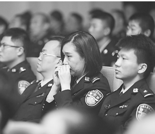
现场民警感动落泪。

敬礼英雄！敬礼英烈！敬礼人民！当日的报告会，一段段荡气回肠的英雄故事震撼人心，让观众跨越时空切身感受公安英烈的崇高理想追求、对人民群众的满腔赤诚、对党和公安事业的无限忠诚。艾热提·马木提经受住了反恐维稳第一线生与死、血与火的洗礼和考验，永远长眠在守护一生的家乡；维和警察和志虹深情告别4岁的儿子，义无反顾前往危机四伏、战火纷飞的异国，照亮了中国维和警察传承不息的和平信仰；刘亚斌在没有硝烟的网络空间战场，与犯罪分子拼时间、抢速度、比谋略，却不幸永远离开了他热爱的公安事业；索连红在同是民警的丈夫宝力格牺牲后，佩戴上他的警号，续写他未完的事业；张子权在父亲张从顺牺牲后，接过父亲的使命，继续负重前行，不幸在办案途中猝然倒地。“一家四警察，父子两忠烈”的英雄事迹传遍大江南北……一段段讲述无不让人动容，洗涤灵魂初心。一个名字，一座丰碑；一串名字，一道脊梁。问苍穹何者不朽？惟忠诚永不落幕。