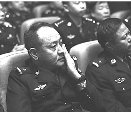
现场民警掩面沉思。