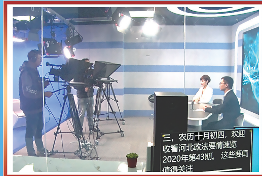
图为《河北政法要情速览》栏目录制现场。截至目前，该栏目已发布190期，受到我省广大政法干警的喜爱。