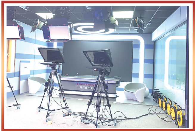
图为河北法制报社全媒体数字演播室。演播室设有导播区、虚拟演播区、实景演播区，能够满足不同节目类型的录制需要。

成绩属于大家，谢谢你们。 因为有了你们才有了现在的成绩。 站在新起点，我们再出发。