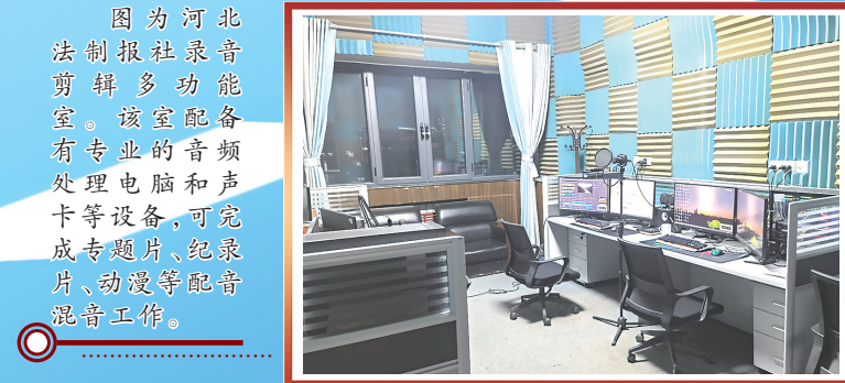
图为河北法制报社录音剪辑多功能室。该室配备有专业的音频处理电脑和声卡等设备，可完成专题片、纪录片、动漫等配音混音工作。