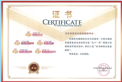
2020年10月，全媒体发展中心运维的河北省委政法委新媒体中心在第五届“五个一百”网络正能量精品评选活动，入选“百项网络正能量榜样”。