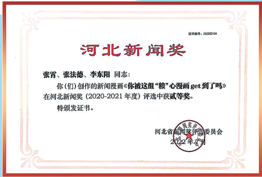
2022年7月，全媒体发展中心创作的新闻漫画《你被这组“粮”心漫画get到了吗》在河北新闻奖（2020—2021年度）评选中获二等奖。