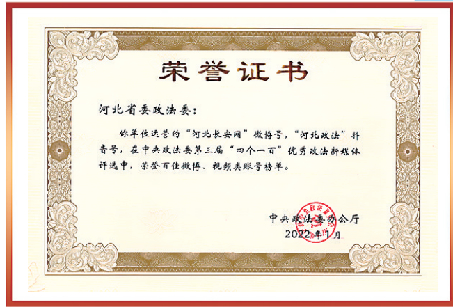
2022年1月，全媒体发展中心运维的“河北长安网”微博号，“河北政法”抖音号，在中央政法委第三届“四个一百”优秀政法新媒体评选中，荣登百佳微博、视频类账号榜单。