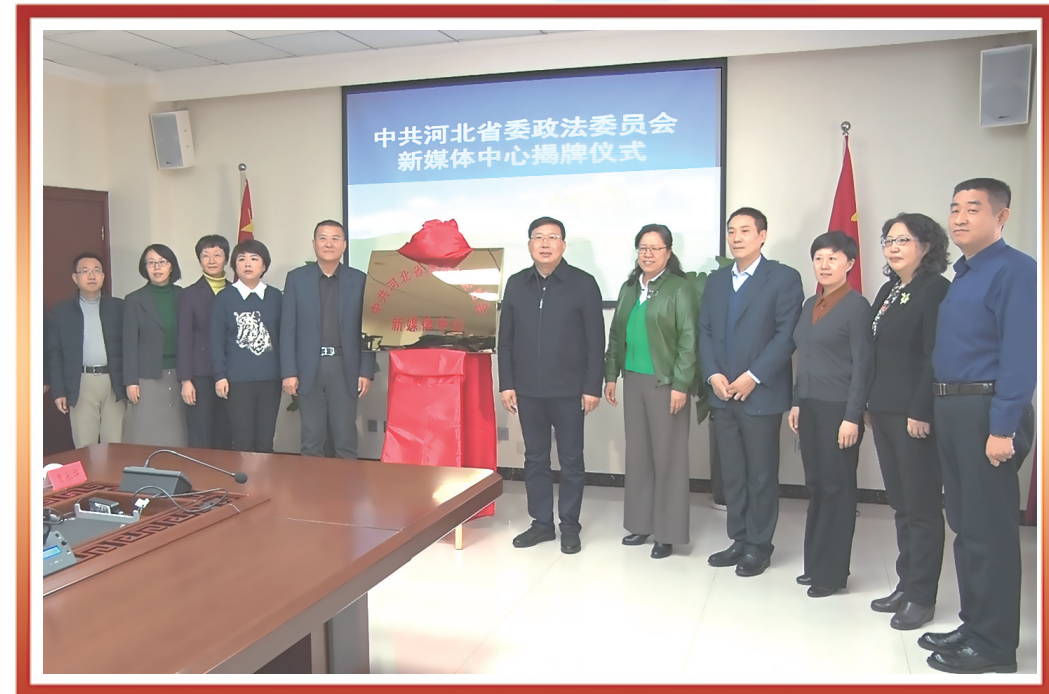
图为2019年，中共河北省委政法委员会新媒体中心揭牌并落户河北法制报社。

习近平总书记强调，要弘扬宪法精神，树立宪法权威，使全体人民都成为社会主义法治的忠实崇尚者、自觉遵守者、坚定捍卫者。 2020年12月4日，是我国第七个国家宪法日，河北法制报创作手绘微视频《国家宪法