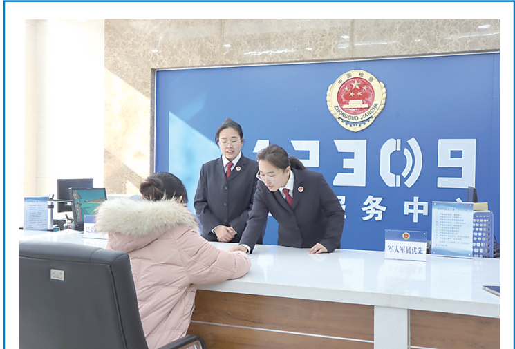
2月18日，春节过后第一个工作日，新乐市人民检察院干警迅速从“假日模式”转入“工作模式”，以饱满的热情投入到紧张、忙碌的工作中。图为该院12309检察服务中心干警热情接待来访群众。

“我们警务站辖区面积相对比较大，管辖1个乡镇、1个牧场、1个林场，住户相对分散，村与村治安状况比较复杂，虽然没有什么重大大案件，（下转第2版）